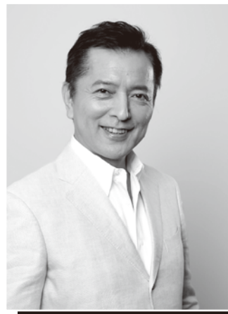
榎木 孝明氏 プロフィール 俳優

一般財団法人 勤労青少年協会 〒150-0012 東京都渋谷区広尾2-11-1-301 F A X (03)3400-8001 携 帯 (090)6015-9447 (E-mail) mail@kinrouseishounen.org (URL) http://www.kinrouseishounen.org